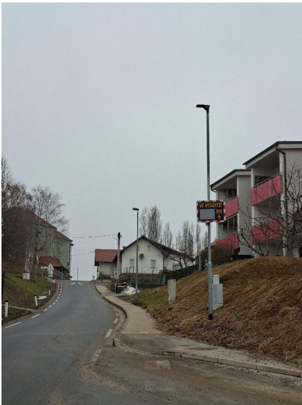
Slika: Lokacija postavitve prikazovalnika hitrosti

Prikazovalnik je bil še isti dan nameščen na lokalni cesti Cerkvjenjak–Vitomarci, v bližini vile Rajh. Meritve se izvajajo iz smeri Vitomarc proti centru Cerkvjenjaka, kjer je omejitev hitrosti 50 km/h, saj se naprava nahaja v naselju. V primeru prekoračitve hitrosti so vozniki na to opozorjeni. Takšne naprave imajo pomembno preventivno vlogo, saj voznike spodbujajo k bolj umirjeni in odgovorni vožnji.